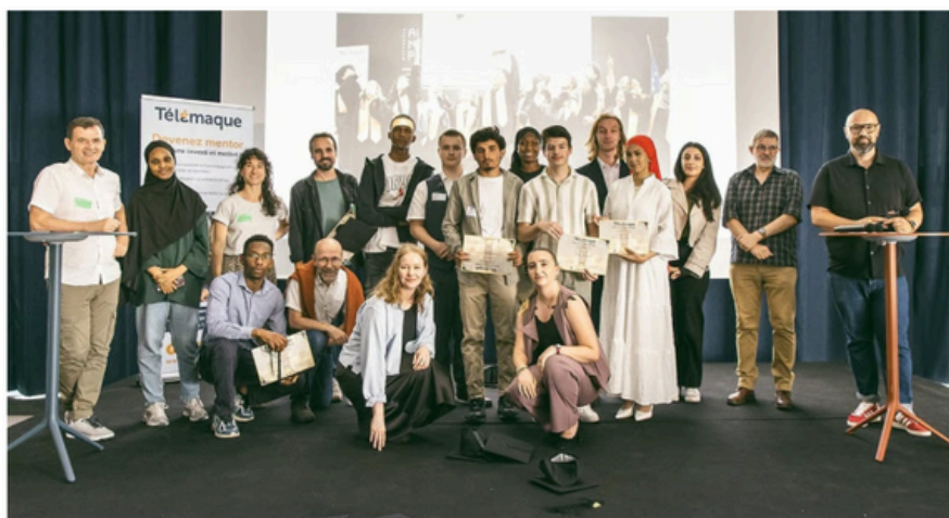
Télémaque fête ses vingt ans de lutte contre les inégalités sociales.

Marie-Pierre Gröndahl Publié le 07/09/25 à 06:00