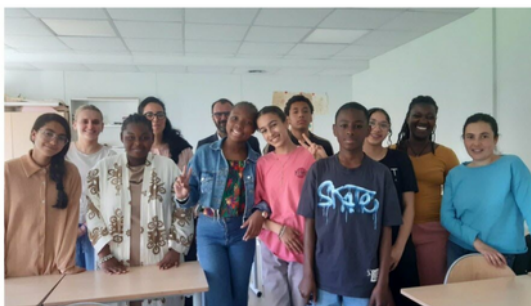
Une partie des "filleuls" de Télémaque avec leurs mentors et les représentants du collège.

Cette année, sept élèves de 5 e , 4 e et 3 e , ont bénéficié du dispositif Télémaque dans leur établissement.