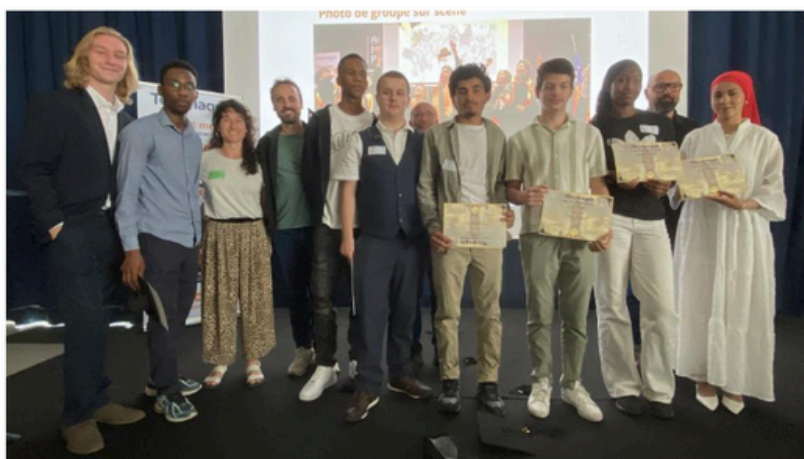
Les bacheliers Télémaque de cette année posent fièrement au côté de certains de leurs mentors.

Dix bacheliers nordistes accompagnés par Télémaque ont célébré leur diplôme au côté de leurs mentors et familles au Kiabi Village à Lezennes. L'association accompagne des collégiens et lycéens de milieux défavorisés et les ouvre au monde professionnel.