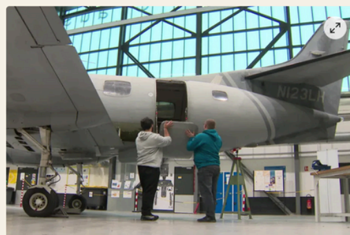
Dans ce lycée professionnel de Clermont-Ferrand, plusieurs élèves sont déjà accompagnés par des mentors.

"Il m'a beaucoup aidé" : des lycéens accompagnés par des mentors pour réussir leur insertion professionnelle